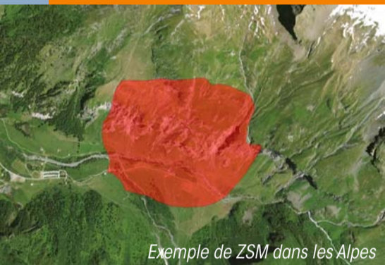
Exemple de ZSM dans les Alpes

C'est un espace d'environ 3 km de large au sein duquel les activités sont susceptibles de porter atteinte aux gypaètes sur leur site de reproduction.